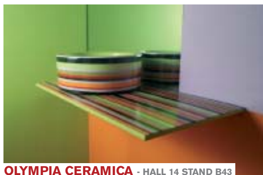
OLYMPIA CERAMICA - HALL 14 STAND B43

The System 30 collection, that introduced in the kitchen the 30 mm thickness for large sized doors with complanate opening, now emphasises very elegant aesthetic standards, based on the use of different materials offered in a harmonious way and based on the idea of functionality of the kitchen product.