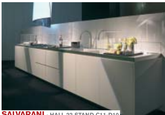
SALVARANI - HALL 22 STAND C11-D10

In the Seventies Long Line has represented a fundamental change in design. Today the Castiglia Associates Studio has drawn on this important name, with an adaptation which is suitable for today's times, in order to present a high design content concept: the innovative raised-edge worktop and the special door ensure that the handle and groove have been definitely surpassed.