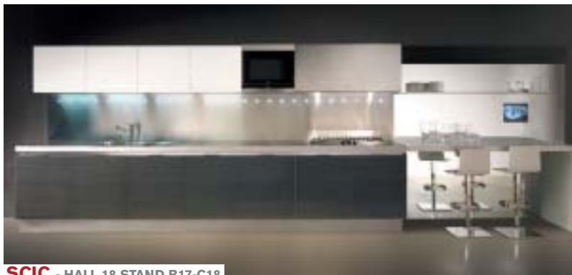
SCIC - HALL 18 STAND B17-C18

From a shape's simplicity, Ayse Birsel and Bibi Seck designed Ice Cube, a range of washbasins, small closets and complements featuring round-shaped, ergonomic and functional shapes. The use of warm and velvet-like materials communicate a sensation of heat.