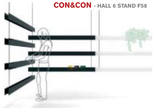
CON&CON - HALL 6 STAND F58