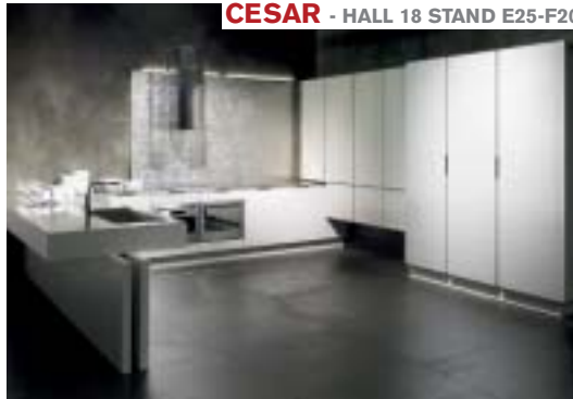
CESAR - HALL 18 STAND E25-F20

Gold Stream is one of the latest Evolution models, a system through which Elica Collection started a new age for the hood. Gold Stream is an eye-catching lamp, due to its mirrored golden lampshade, that in the internal side offers the pureness of white. The blown glass material is enriched with a pattern with soft waves on it.