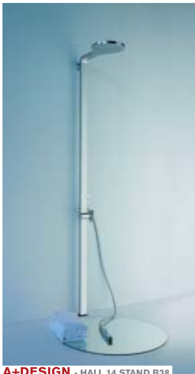
A+DESIGN - HALL 14 STAND B38

Yara has been made over in its finishes and completed by new hi-tech features without losing its reassuring warmth. Impressive and minimalist, it embodies the trend of combining the kitchen with the living room. In this way, Yara becomes a place to be enjoyed with all ones senses: beauty to view and pleasure to feel thanks to the great thicknesses and to the bold lines that are set off by the chunky texture of brushed yellow pine, by the warmth of teak and walnut and by the elegance of birch.