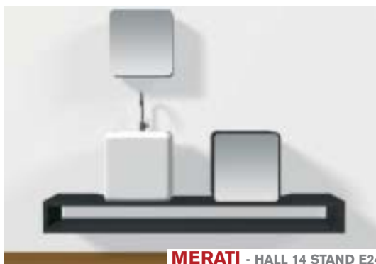
MERATI - HALL 14 STAND E24

Lago explores new environments of the home and launch a new unit system for kitchens and bathrooms by adapting with versatility systems created for the night zone and the day zone. The 36.8cm by 36.8cm unit is the point of departure with which containers are obtained that are positionable horizontally and vertically can be composed in endless variations based on a hypothetical grid that leaves total freedom for composition and the maximum creativity.