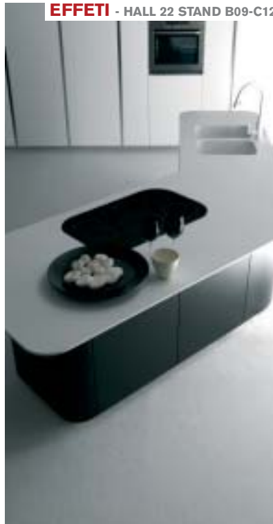
EFFETI - HALL 22 STAND B09-C12

For the Sweep shower system, A+ Design offers an innovative polished steel circular atomiser, that homogenises and transforms the water jet as a water veil. The water cylinder emission is possible thanks to a silicone -moulded packing.